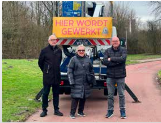
Promotie van het project voor de bijdrage uit Kern met Pit.

opgetuigd. Helaas bracht dat niet het bedrag bij elkaar dat nodig was. Wat gelukkig wel steeds doorgaat is dat Ommoorders gewoon rechtstreeks giften overmaken aan de Stichting. Dat was ook dit en vorig jaar het geval. Wij hopen dat bewoners dat vooral blijven doen. Dat kan door giften te storten op de bankrekening van Stichting De Witte Bollen, rekeningnummer NL 32 INGB 0006 0542 81. Als u een specifiek kunstwerk wilt steunen vermeld dat dan s.v.p. Ook worden er via de donaties van statiegeld bij Albert Heijn op de Hesseplaats regelmatig giften ontvangen. Het schilderwerk aan het kunstwerk Scheidende Wegen is nu klaar. Het totaalbedrag is in drie gelijke stukken gefinancierd (1) korting/sponsoring door de uitvoerende aannemer, (2) bijdrage uit een gemeentelijk onderhoudsfonds en (3) donaties en giften van bewoners. Het laatste deel is nog niet helemaal voldoende ingevuld. Daarom zijn we nog in de race voor een bijdrage van Kern met Pit (Kern met Pit daagt mensen uit om hun droom voor de eigen buurt binnen een jaar te realiseren. Kern met Pit is een initiatief van Katalys) en een bijdrage van het centrum Beeldende Kunst Rotterdam om als sluitstuk de financiering rond te maken.